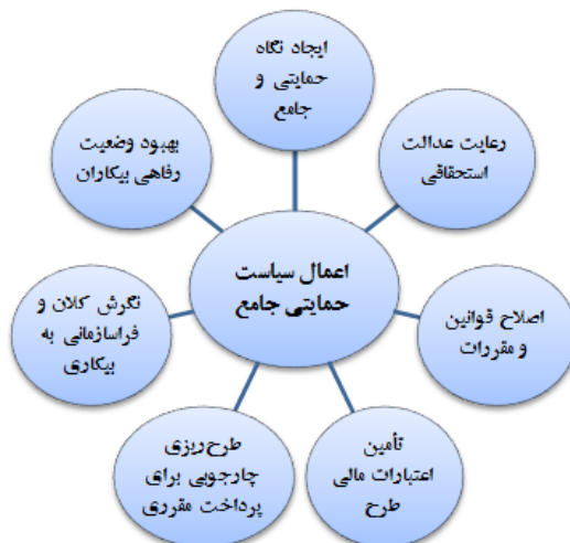
شکل ۲: مفصل‌بندی گفتمان سیاست رفاهی حاکم بر بیکاری در طرح بیمه بیکاری ایام کرونا