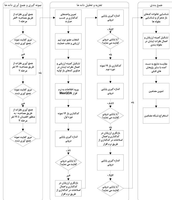
شکل ۱: فرایند تحلیل محتوا و کنترل کیفیت پژوهش مطابق با مدل (Schou et al., 2012)

اعتبارپذیری: هدف، روش پژوهش، جمع آوری و ثبت داده ها روشن شده است. کدبندی ها (تحلیل داده ها) با نظارت کمیته ارزیاب و با استفاده از نظرات یک تیم دو نفره ارزیابی انجام و از واقعی بودن توصیف ها و یافته های پژوهش اطمینان حاصل شده است. ضمناً چهارچوب مصاحبه برپایه نتایج سایر پژوهش های مشابه طراحی شده است. انتقال پذیری: شیوه انتخاب اطلاعات و جامعه و اعضای نمونه تشریح شده است؛ شیوه کدبندی های صورت گرفته و همچنین چگونگی استخراج آن ها تشریح شده است؛ زمینه پژوهش شامل زمان و مکان و ... مشخص است؛ رابطه بین پژوهشگر و زمینه پژوهش مشخص است. تعداد نمونه ها در این پژوهش به توصیه عمومی حدود ۲۰ مورد در نمونه گیری های نظری را رعایت کرده است و لذا توصیف غنی از نظرات جمع آوری شده است. ضمناً با توجه به آنکه اعضای نمونه از لایه های مختلف صنعت بیمه شامل بیمه مرکزی، شرکت های بیمه، شبکه فروش و شرکت های تأمین کننده در مصاحبه ها حضور داشته اند، نتایج این پژوهش جهت استفاده در برنامه ریزی ها از نگاه لایه های مختلف